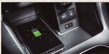
Cargador inalámbrico (Wireless Charging)