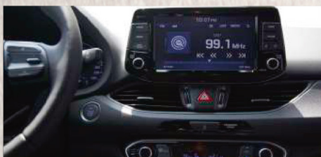
Radio táctil 8" + MP3 + Bluetooth con sistema Android Auto y Apple Car Play