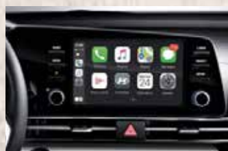
Radio táctil de 8" con Andriod Auto y Apple CarPlay