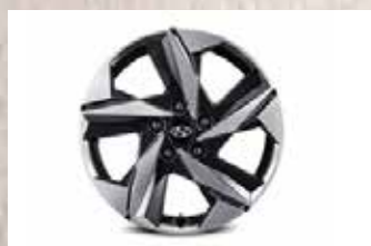
Aros de aleación de 17"