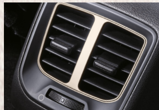
Aire acondicionado con ventilas en la segunda fila