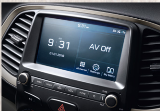
Radio de 7" con Apple CarPlay y Android Auto